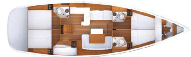
5 Kabinen, 10 to 13 (15) Kojen