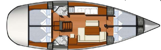
4 Kabinen, 8 to 10 (12) Kojen