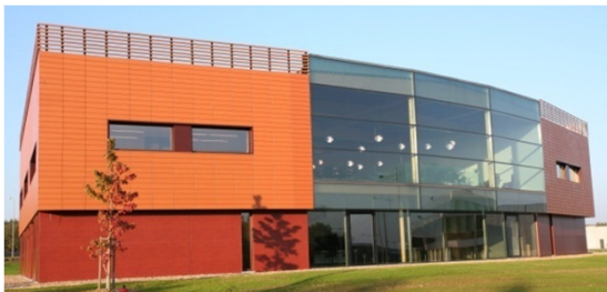
IPS Kompetenzzentrum, Belgien