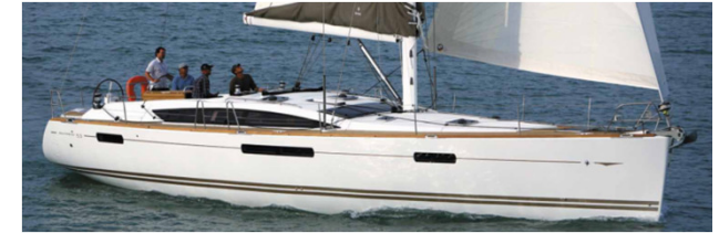
ImPulSe, Jeanneau 53 Performance, 2010.

IPS TeamSailor verfügt über eigene Segelyachten in Performance-Version. ImPetuS und ImPulSe liegen in Korsica (Isola Bella) vor Anker, wodurch das ganze Jahr über grossartige Möglichkeiten zum Segeln bestehen.