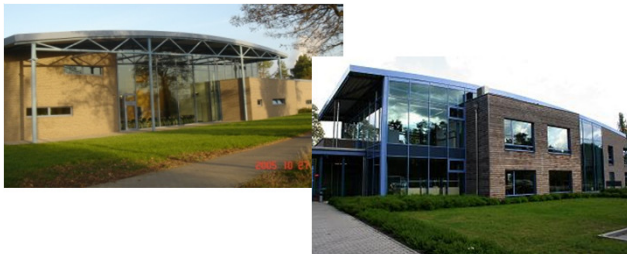
IPS Technologiezentrum, Deutschland

Diese Initiative geht einher mit dem IPS Technologiezentrum, der firmeneigenen Projektmanagement-Schule und dem IPS Kompetenzzentrum, in welchem die Kompetenzen der Gruppe zentralisiert und weiterentwickelt werden.