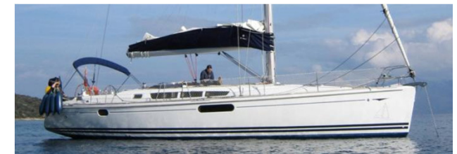
ImPetuS, Jeanneau SO44i Performance, 2009

In den voll ausgestatteten Yachten geniessen Sicherheit, Gesundheit und Komfort Top Priorität.